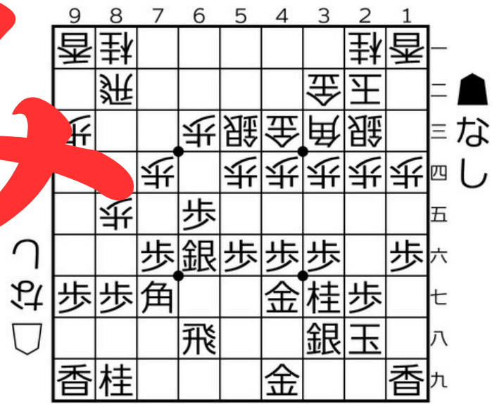
四間飛車▲6六銀型+高美濃