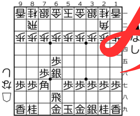
四間飛車▲6六銀型 かた