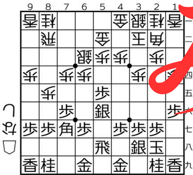
中飛車▲5六銀型+美濃