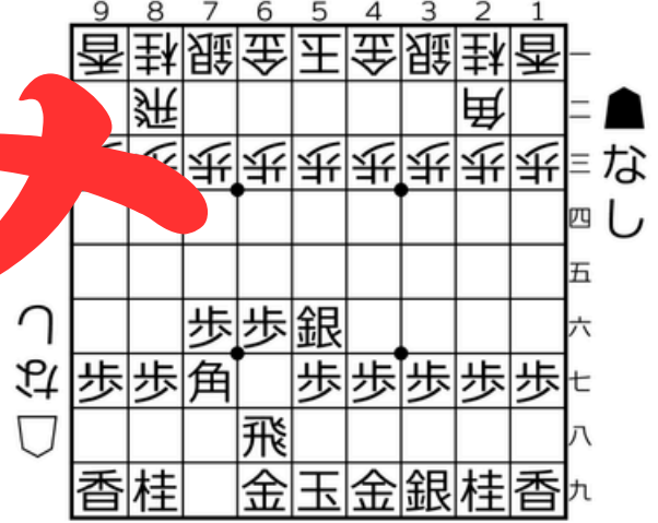
四間飛車▲5六銀型 かた