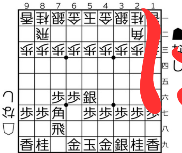
三間飛車▲5六銀型 筋