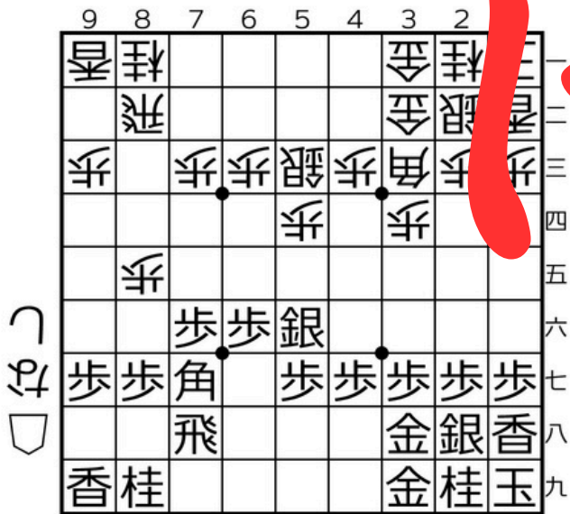
三間飛車▲5六銀型+穴熊