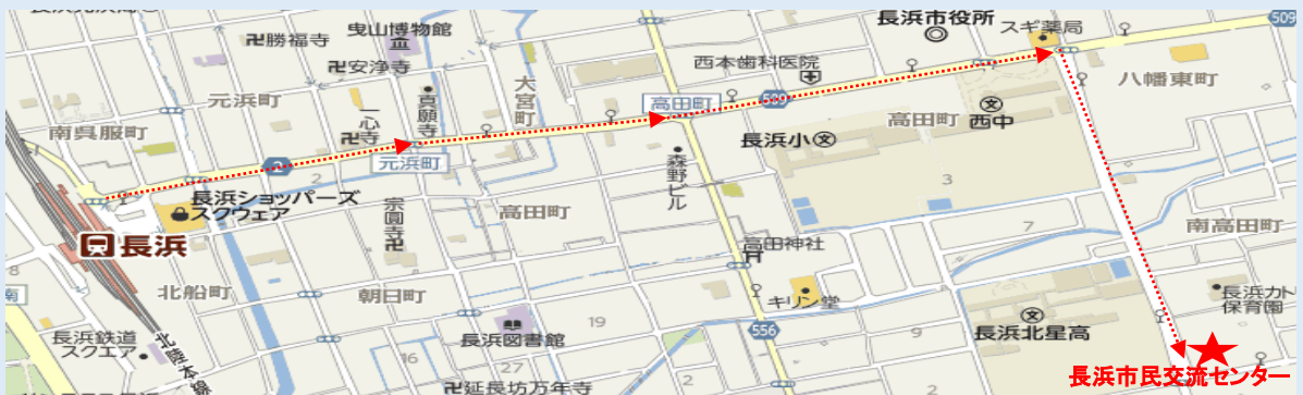
上図：会場アクセスマップ