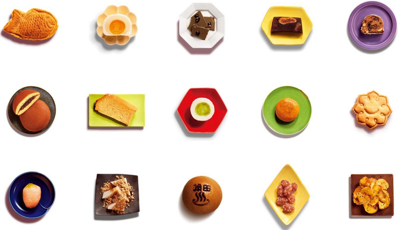
▲和スイーツイメージ

そのような和スイーツの名店が、池上本門寺に集結。中でも、古民家カフェ蓮月(池上駅)、和菓子処清野(蒲田駅)では、わフェス限定のオリジナル和スイーツを創作し、提供します。わフェス限定なので、食べられるのは11月11日(土)と12日の2日間だけです。和スイーツ好きには食べ逃せない一品となっております。