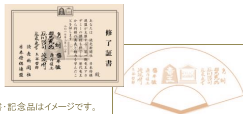
※修了証書・記念品はイメージです。